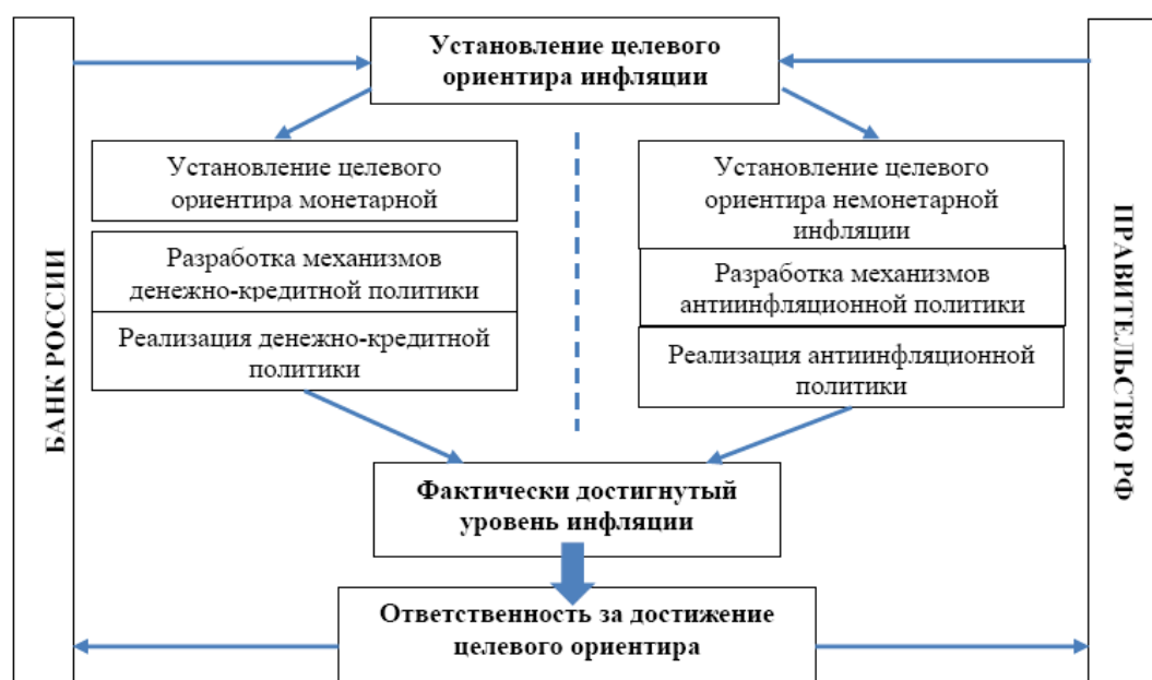
Рис. 2. Модель разделения полномочий и ответственности в реализации антиинфляционной политики [4, с. 400]

Весьма очевидно, что Банк России в условиях современного развития отечественной экономики может оказывать влияние на весьма ограниченный спектр причин возникновения инфляции, тем самым всю ответственность за достижение целевых показателей по инфляции возлагать только лишь на Банк России было бы конечно же несправедливым. Следовательно, возникает проблема установления полномочий и ответственности в рамках государственной антиинфляционной политики. Далее представлена модель разделения полномочий и ответственности в реализации антиинфляционной политики, которая предполагает разделение полномочий и ответственности за монетарную и немонетарную инфляцию (рисунок 2) [4, с. 400].