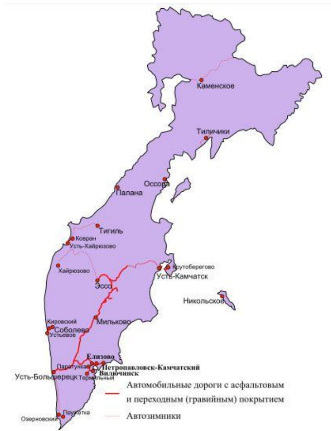
Рис. 1. Дорожная инфраструктура Камчатки