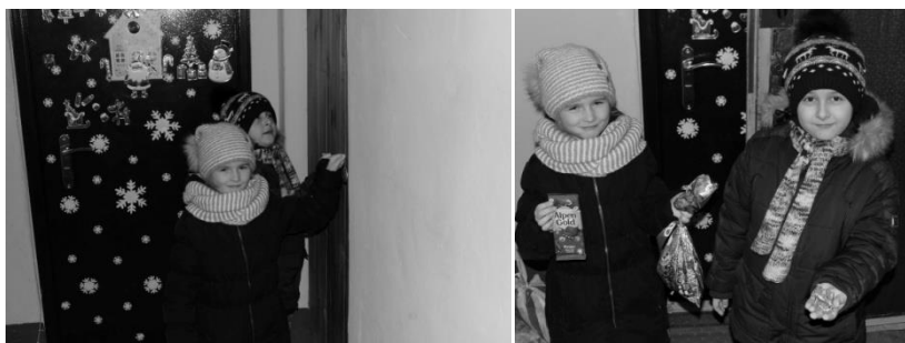
Рис. 2. Фото 3,4. Подготовка и проведение старинного обряда колядования на Старый Новый год

Новый год - важное событие в жизни россиян, к нему готовятся заранее всей семьёй. В каждом доме ставят новогоднюю ёлочку и украшают её игрушками. В новогоднюю ночь все собираются за праздничным столом, поздравляют друг друга. Все дети с нетерпением ждут подарков, которые приносят Дед Мороз и Снегурочка (персонажи из мифологии восточных славян). В детских садах и школах проводят новогодние утренники для детей. Во время праздников приглашают друзей к себе и сами ходят в гости (фото 3, 4).