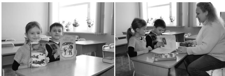
Рис. 1. Фото. Работа с научной и художественной литературой по истории празднования Нового года в России

У каждого народа есть свои традиции празднования Нового года. Детей очень заинтересовал вопрос: как люди праздновали Новый год в древние времена на Руси и сейчас? Актуальность исследовательской работы – сохранение новогодних традиций в современной России. Цель: изучить историю и особенности развития празднования Нового года в России. Гипотеза: дети предположили, что история празднования Нового года на Руси очень интересна, и это нашло своё отражение в современных новогодних традициях и обычаях. Из книг узнали, как было принято праздновать Новый год в разные исторические времена в России, познакомились со старинными обычаями (фото 1, 2).