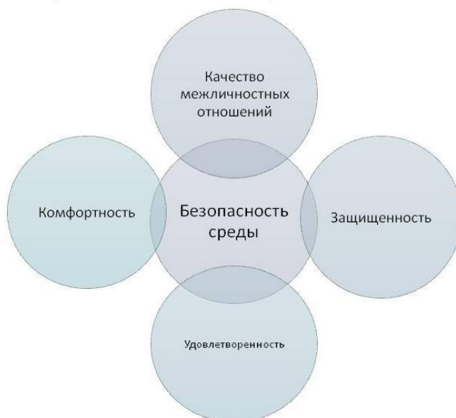
Рис. 2. Модель психологической безопасности образовательной среды школы