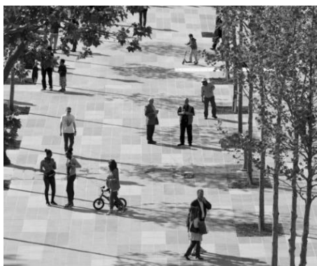
Рис. 5. Реконструкция Плас-де-ла-Републик, Франция, Париж, общий вид [8]

В современных городах под площадями «кипит» жизнь – линии метро, торговые павильоны, пешеходные переходы, автомобильные парковки. Высаживание деревьев с их мощной корневой системой становится невозможным. И озеленение таких мест требует нового решения. Пример - реконструкция площади Сальвадора Дали в Мадриде, где используются клинообразные ландшафтные конструкции, воссоздающие холмы, включающие в себя скамейки для отдыха и декоративное освещение. Образуя высокую насыпь, на этих участках высаживаются растения (Рис. 6).