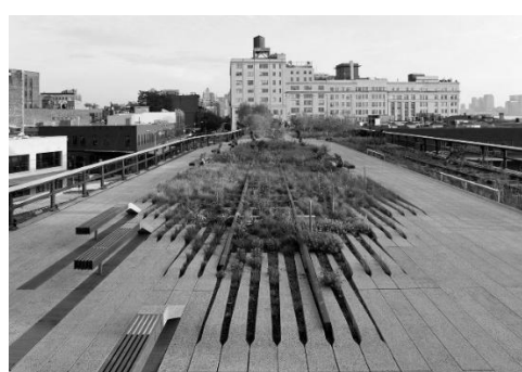
Рис. 1. США, Нью-Йорк, High Line Park, вид сверху (слева) [5]