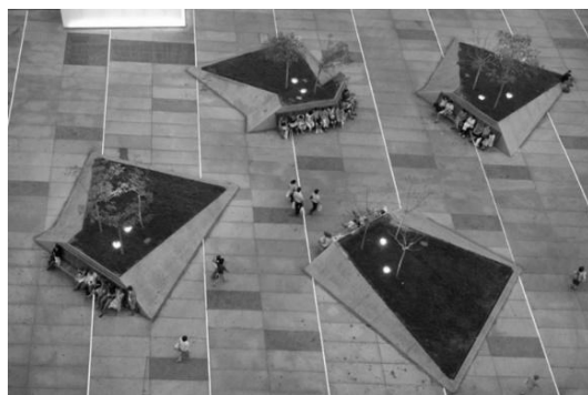
Рис. 6. Реконструкция площади Сальвадора Дали, Испания, Мадрид, общий вид (справа) [9]

В современных городах под площадями «кипит» жизнь – линии метро, торговые павильоны, пешеходные переходы, автомобильные парковки. Высаживание деревьев с их мощной корневой системой становится невозможным. И озеленение таких мест требует нового решения. Пример - реконструкция площади Сальвадора Дали в Мадриде, где используются клинообразные ландшафтные конструкции, воссоздающие холмы, включающие в себя скамейки для отдыха и декоративное освещение. Образуя высокую насыпь, на этих участках высаживаются растения (Рис. 6).