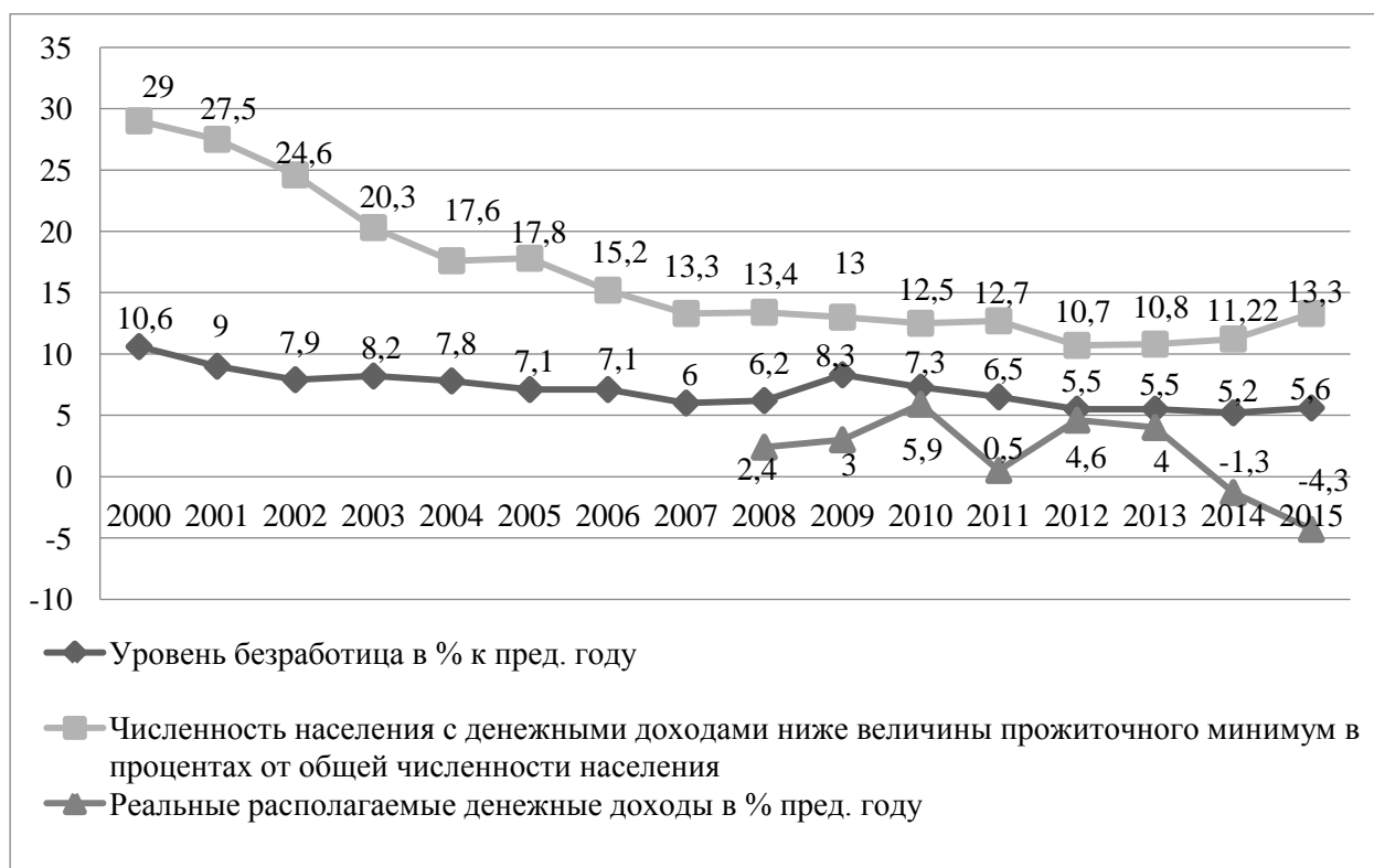
Рис. 1. Динамика уровня безработицы, численности населения с денежных доходов ниже величины прожиточного минимума, реальных располагаемых денежных доходов

Официальными показателями бедности принято считать численность и долю населения с денежными доходами ниже прожиточного минимума, величина которого ежеквартально утверждается Правительством в соответствии с Федеральным законом «О прожиточном минимуме в Российской Федерации».