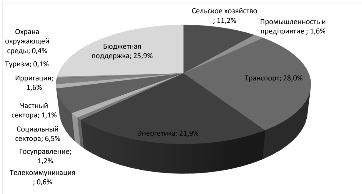
График 3. Финансовая помощь в разрезе секторов с 1992 по июль 2015 гг.

В последние года отмечается тенденция увеличения в объемах освоения кредитов и грантов. Это напрямую связано с увеличением объема привлекаемых донорских средств.