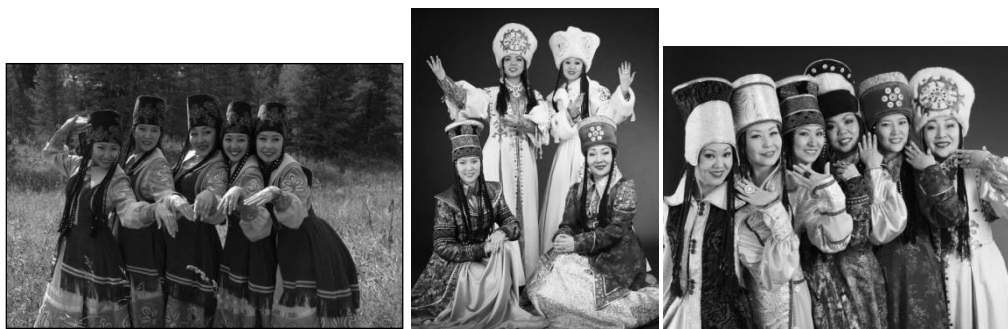
Рис. 2. Национальная одежда сегодня

В национальной одежде сейчас уже не ходят каждый день, и нагрудное украшение Пого в повседневной жизни дети не увидят, но на праздниках можно увидеть и традиционную одежду, и стилизованную.