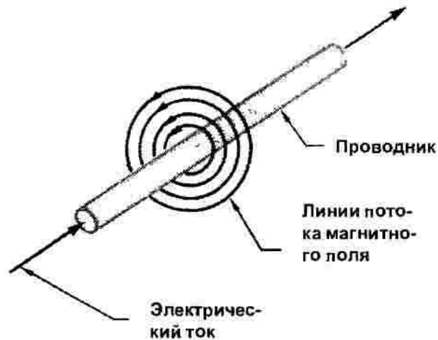
Рис. 2. Движение энергии в проводниках с током

Но т.к. движение энергии по проводам аналогично движению ЭМВ (рис. 2 и 3) последние также стягиваются, формируя фотоны. То есть материальные частицы – фотоны образуются и состоят из ЭМВ.